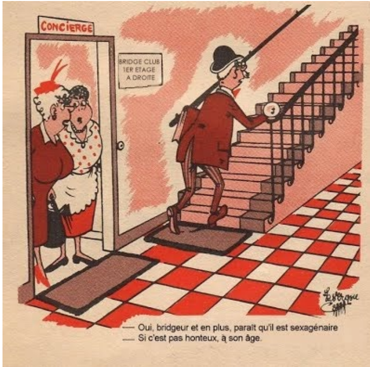
— Oui, bridgeur et en plus, paraît qu'il est sexagénaire — Si c'est pas honteux, à son âge.