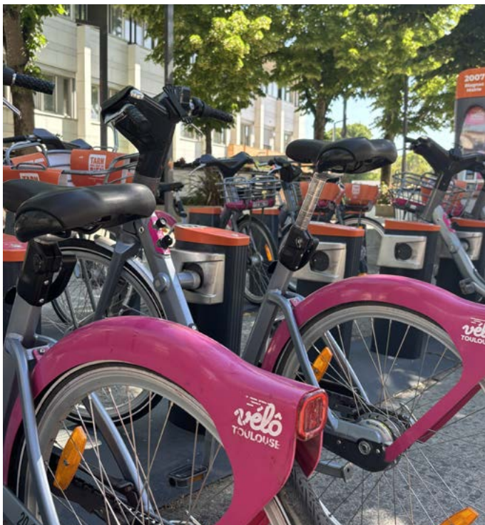
> Avec ou sans assistance électrique, faites votre choix !

Pour retrouver l'implantation des stations et en savoir plus sur le service, rendez-vous sur velotoulouse.tisseo.fr <