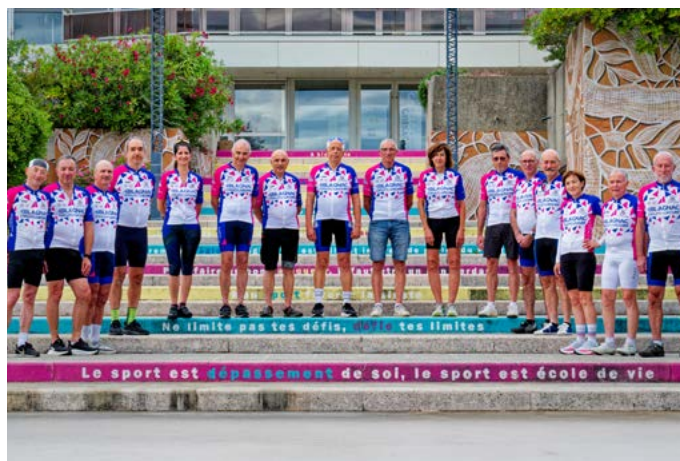
> Des formes géométriques de tailles variables et des couleurs chatoyantes pour symboliser la diversité et la tolérance.

Le Guichet mairie se tient à votre disposition du lundi au vendredi de 8h30 à 12h et de 13h30 à 18h et samedi de 9h à 12h30 (*Mardis fermés de 11h à 12h les semaines paires) ou par téléphone au 05 61 71 72 00. <