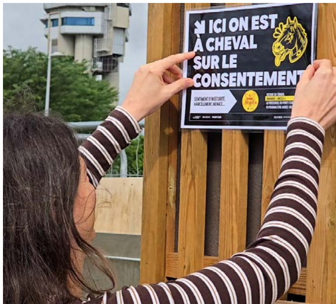
> Des slogans percutants pour sensibiliser tous les publics.