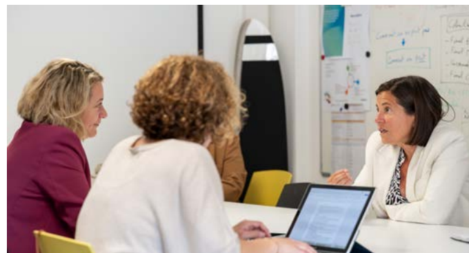
> Des échanges enrichissants entre les deux dirigeantes.