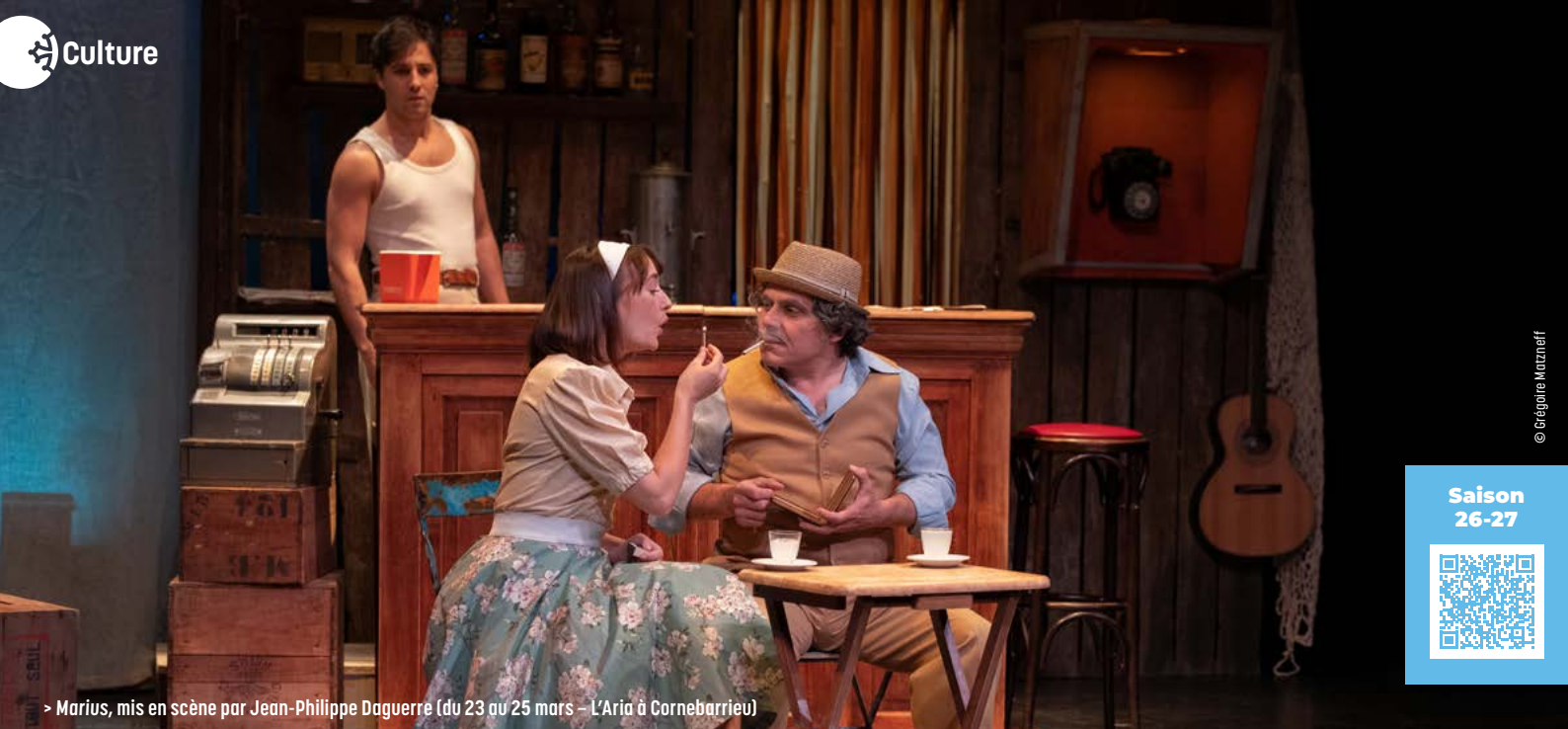
> Marius, mis en scène par Jean-Philippe Daguerre (du 23 au 25 mars – L’Aria à Cornebarrieu)