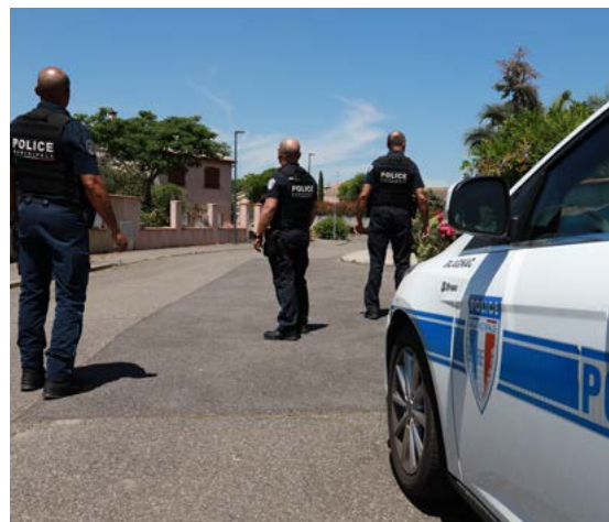
> Durant l'été, les policiers municipaux surveillent les résidences des Bagnacais dans le cadre de l'opération tranquillité vacances "OTV".

Pour découvrir le cadre d'action de la Police municipale, rendez-vous sur bagnac.fr <