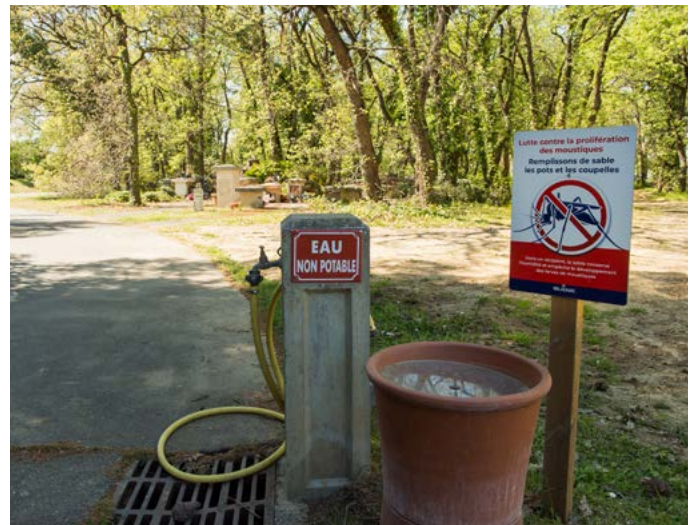
> Des panneaux de sensibilisation à la lutte contre les moustiques au cimetière Parc.

Chaque mois, un prestataire de la Ville procède à des opérations de démoustication des points d'eau du domaine public au moyen d'un larvicide sélectif et biologique, sans danger pour l'environnement. À cela s'ajoute l'entretien régulier des quelques 200 pièges pondoir installés dans les parcs et jardins. Autres lieux susceptibles de contribuer à la prolifération des moustiques : les cimetières où du sable est mis à disposition des visiteurs pour remplir jardinières, pots de fleurs et soucoupes. <