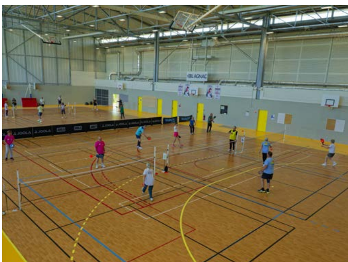
> Des seniors pleinement investis dans leurs passes.

Pour en savoir plus sur l'association BIGRES, rendez-vous sur sites.google.com/view/bigres <