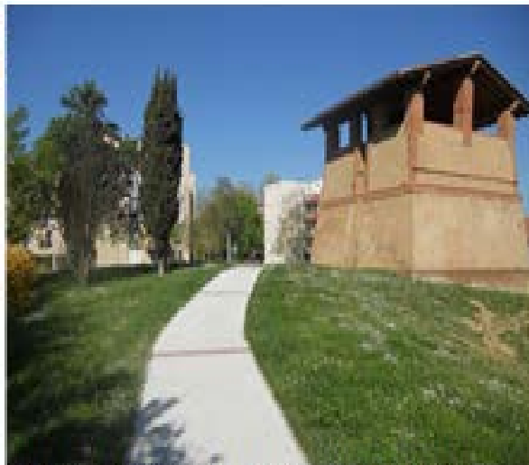
Mise aux normes de l'accès du Four à briques