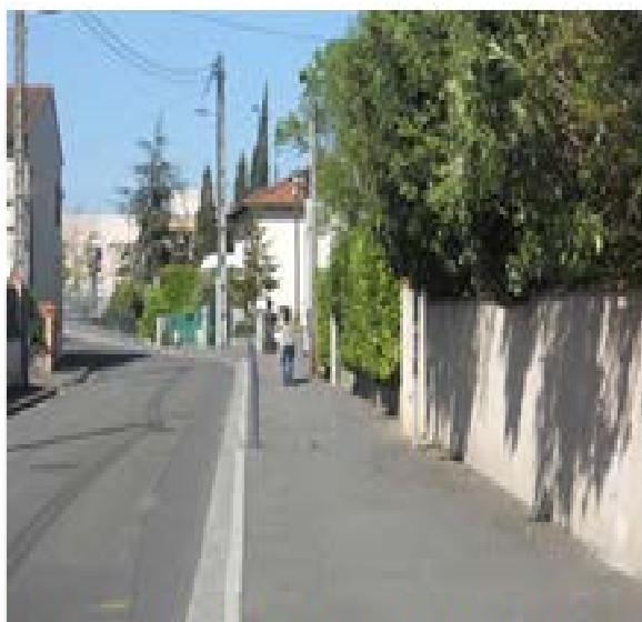
Rue Pasteur mise aux normes de l'accessibilité