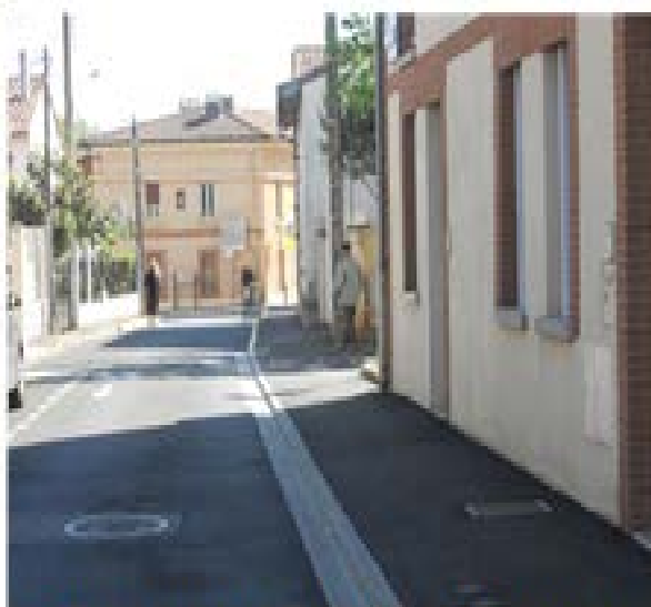
Rue Sarrazinière – Travaux d'aménagement intégrant l'accessibilité