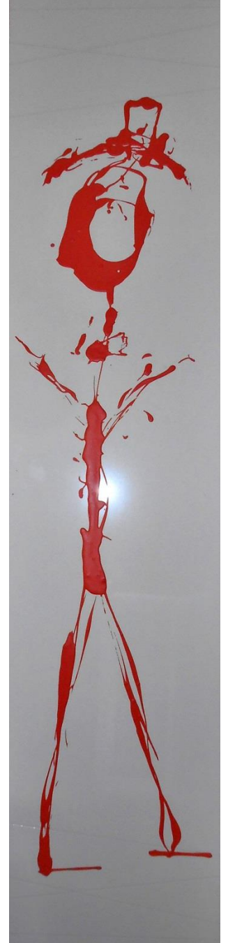
Le bon homme