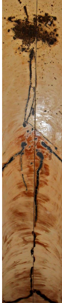
L'homme deviendra Autruche